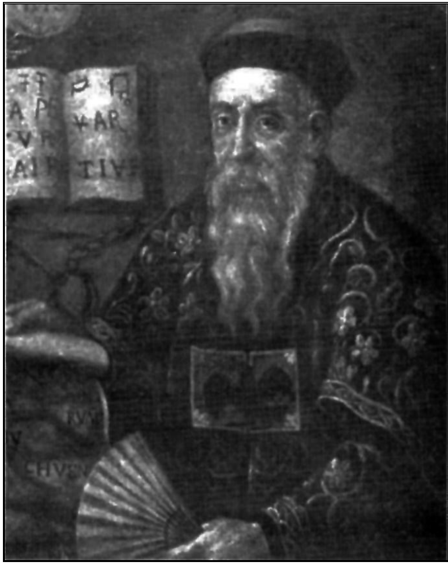
Ritratto di Ludovico Buglio